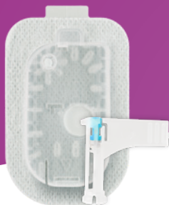
Infusionseinheit (= Pumpenhalterung & Kanüle)