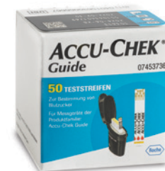
Accu-Chek Guide Teststreifen