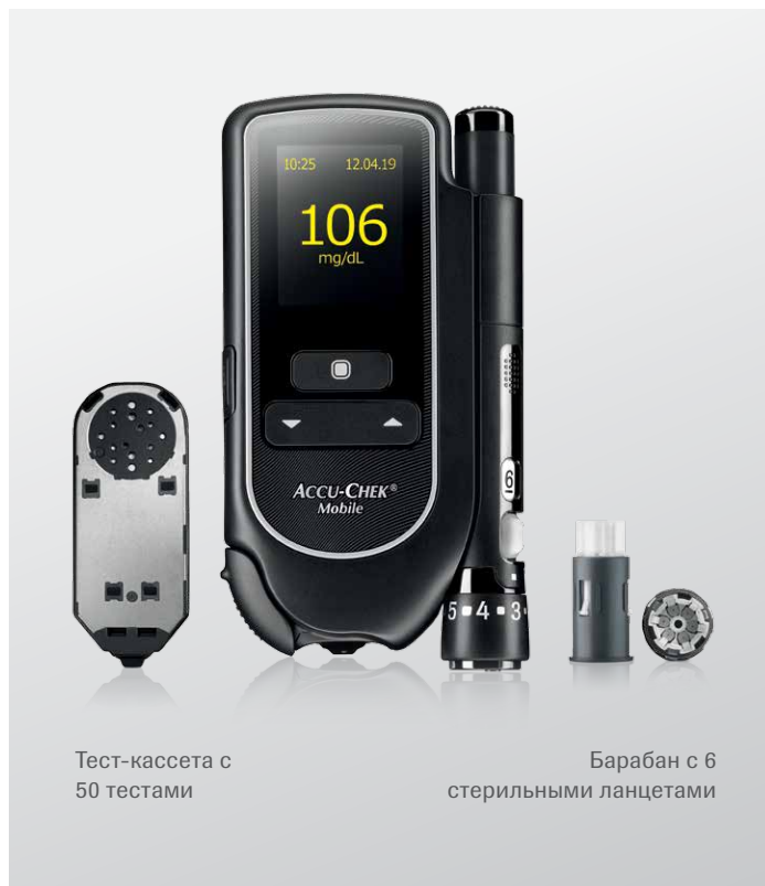
Тест-кассета с 50 тестами

4 Закрывать Примерно через 5 секунд можно считать результат. При закрытии предохранителя глюкометр выключается.