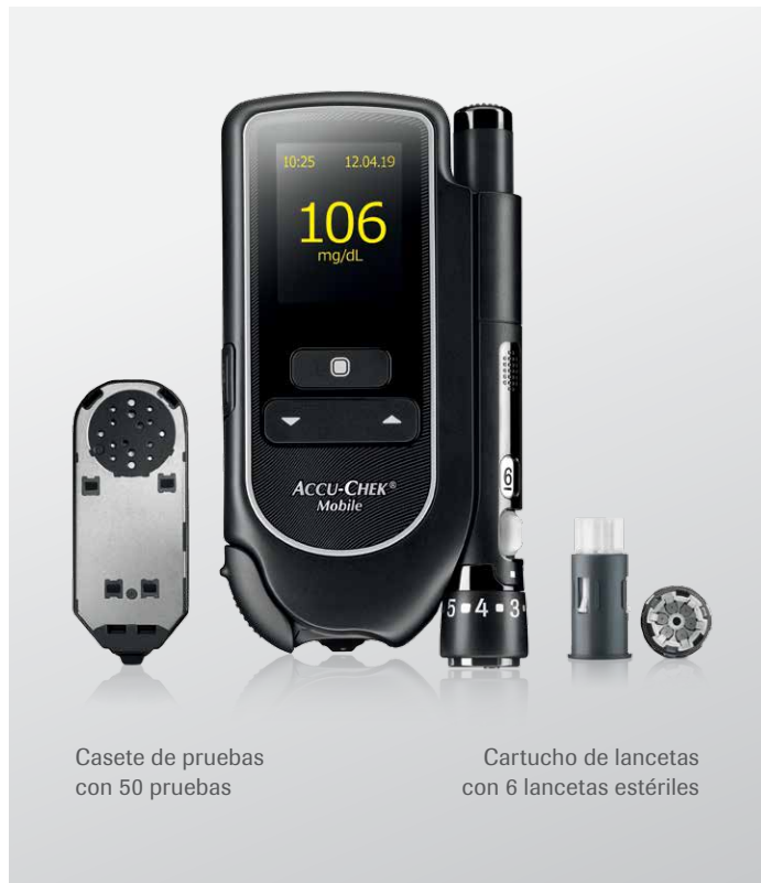
Casete de pruebas con 50 pruebas

4 Cerrar Puede leer el resultado transcurridos aproximadamente 5 seg. El glucómetro se apaga al cerrar la protección de la punta.